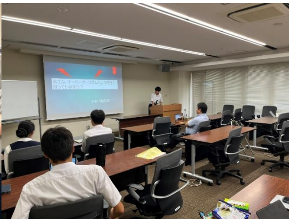
工学系研究科での研修