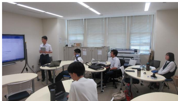
工学系研究科での研修