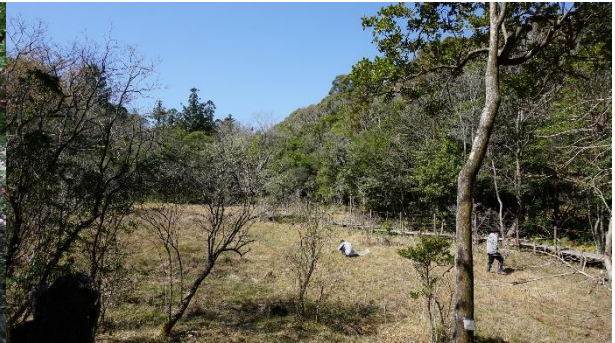
ハルリンドウの調査