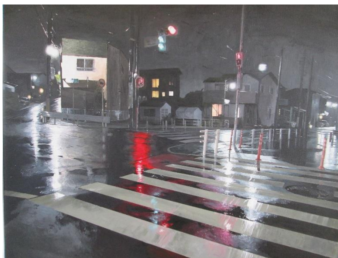
R4_全国総文祭出展作品 (3年生作品)