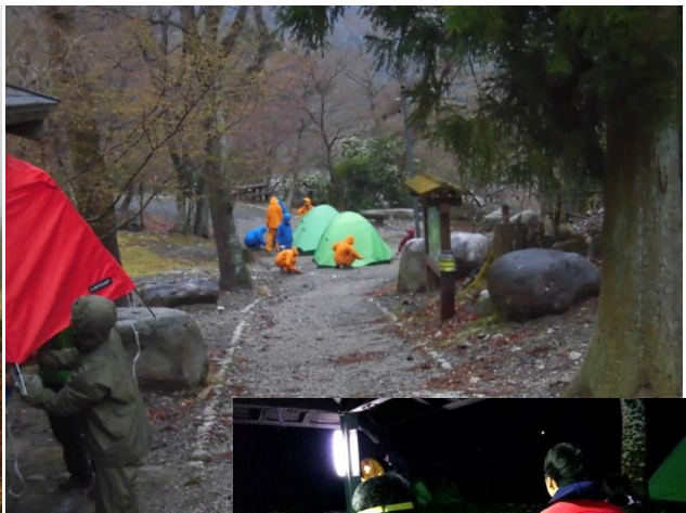
[雨の中でのテント設営]