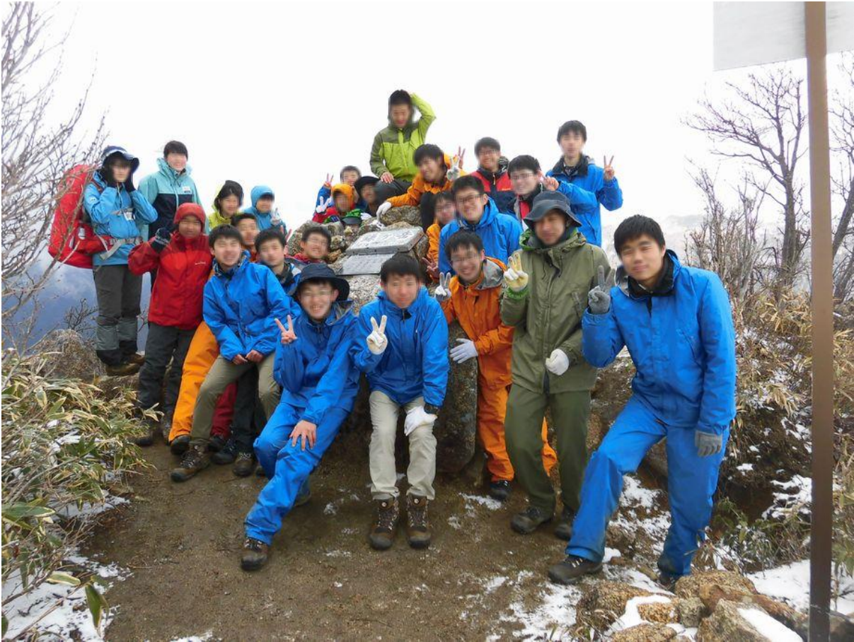
[雲母峰Ⅱ峰からの眺め]